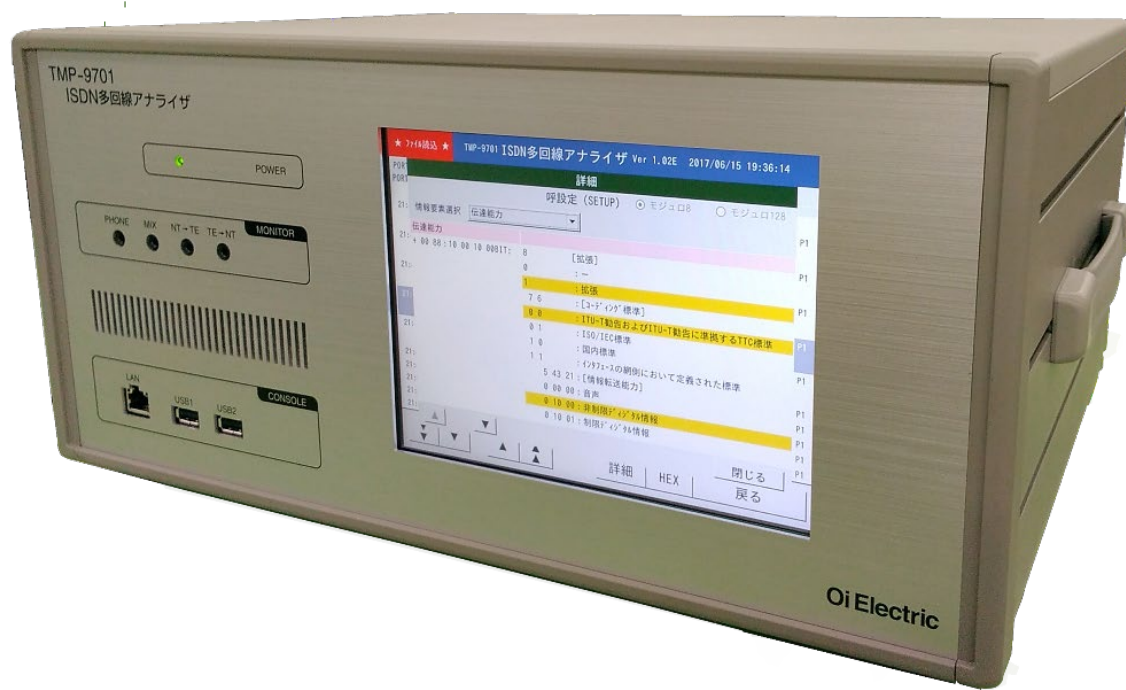
13kg以下(添付品、オプション含まず) 430mm(W) × 199mm (H) × 350mm(D)

LCD表示器とタッチパネルの採用により測定設定や、測定データの解析を簡単な操作で実現しています。