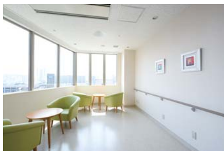
病院内のどこにいてもお呼出できます。