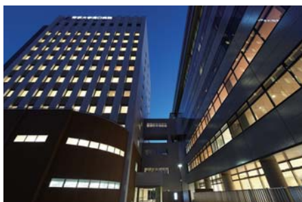
入院棟(左)と外来・管理棟(右)