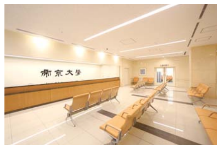
広々とした中央受付