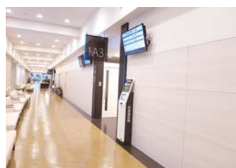
外待ちには42インチモニター設置