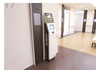
中待合入口には到着確認機