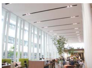
カフェのあるけやきサロン