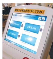
入院受付システム