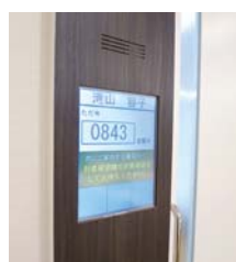
建築デザインに合わせてのカスタマイズ仕様の縦型15インチ