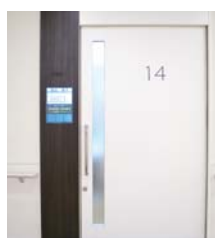
各科の外待ちホール