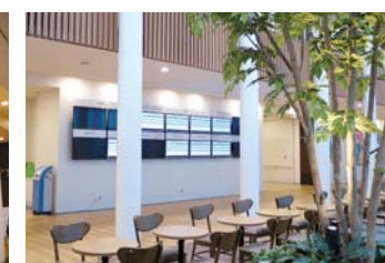
けやきサロン前42インチ12面に全科診察状況表示