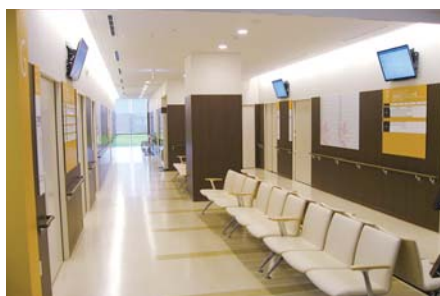
診療ブース前待合

電子カルテの操作をすることにより、表示画面に案内を表示する仕組みとなっております。