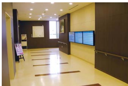
洗練された落ち着いたある院内