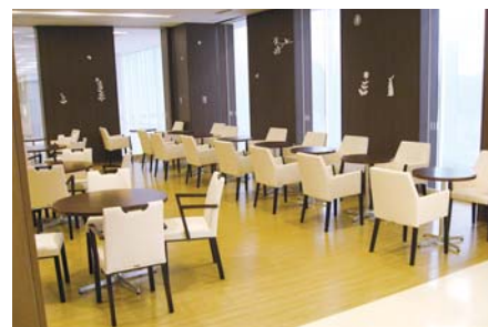
快適に過ごせるカフェエリア