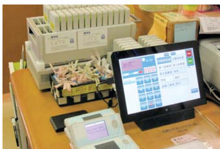
10インチタブレットPC操作機

当社で施工したWi-Fiインフラで患者呼出以外に、職員及び患者サービスとしての患者様用インターネット環境等も構築しております。