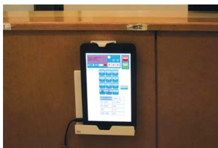
8インチタブレットPC操作機