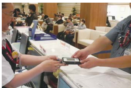
PHS呼出カード末端渡し風景