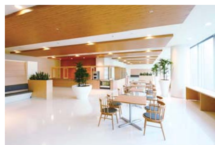
ダイニング和カフェ