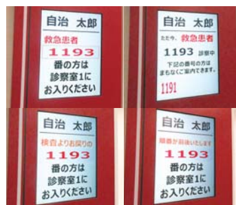
割り込み対応表示機能でトラブル解消