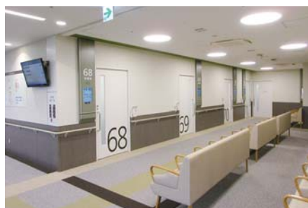
診察室待前には壁付型表示機を配置