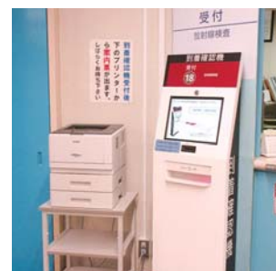
到着確認機で医師も安心