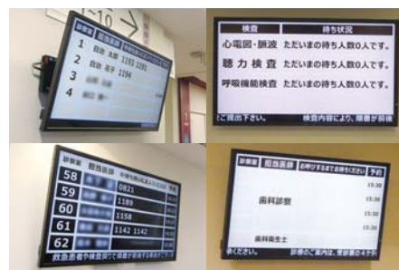
部門毎のわかりやすい表示案内 眼科はバックをブラックで見やすく。