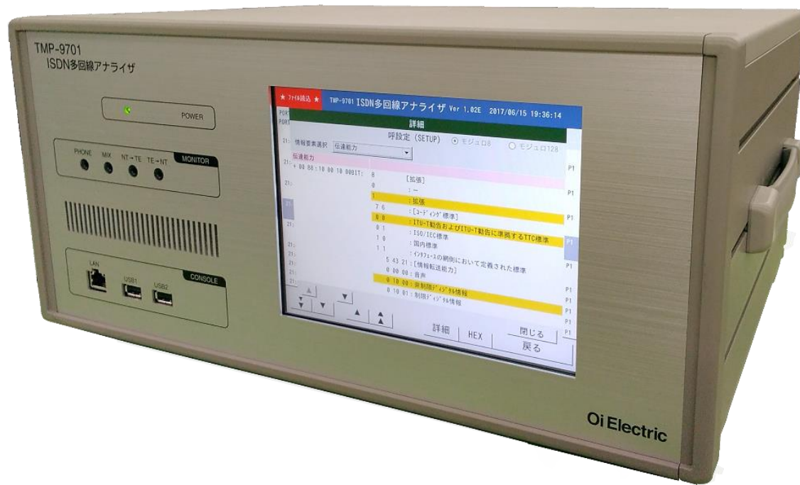
13kg以下(添付品、オプション含まず) 430mm(W) × 199mm (H) × 350mm(D)

LCD表示器とタッチパネルの採用により測定設定や、測定データの解析を簡単な操作で実現しています。