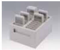
電源 ON/OFF 回収箱(10 台用) 高 101×幅 166×奥 114mm 0.8kg (*写真は 20 台用、他に 30 台用もあり)